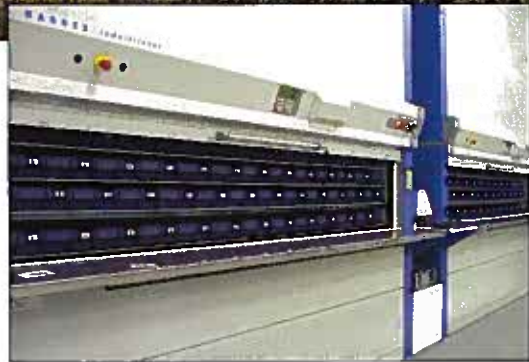
Une fois la commande programmée par un logisticien, le robot cherche le produit demandé parmi 150 000 références. Les lentilles de contact, solutions d'entretien ou les verres sont ensuite livrés le lendemain avant midi.