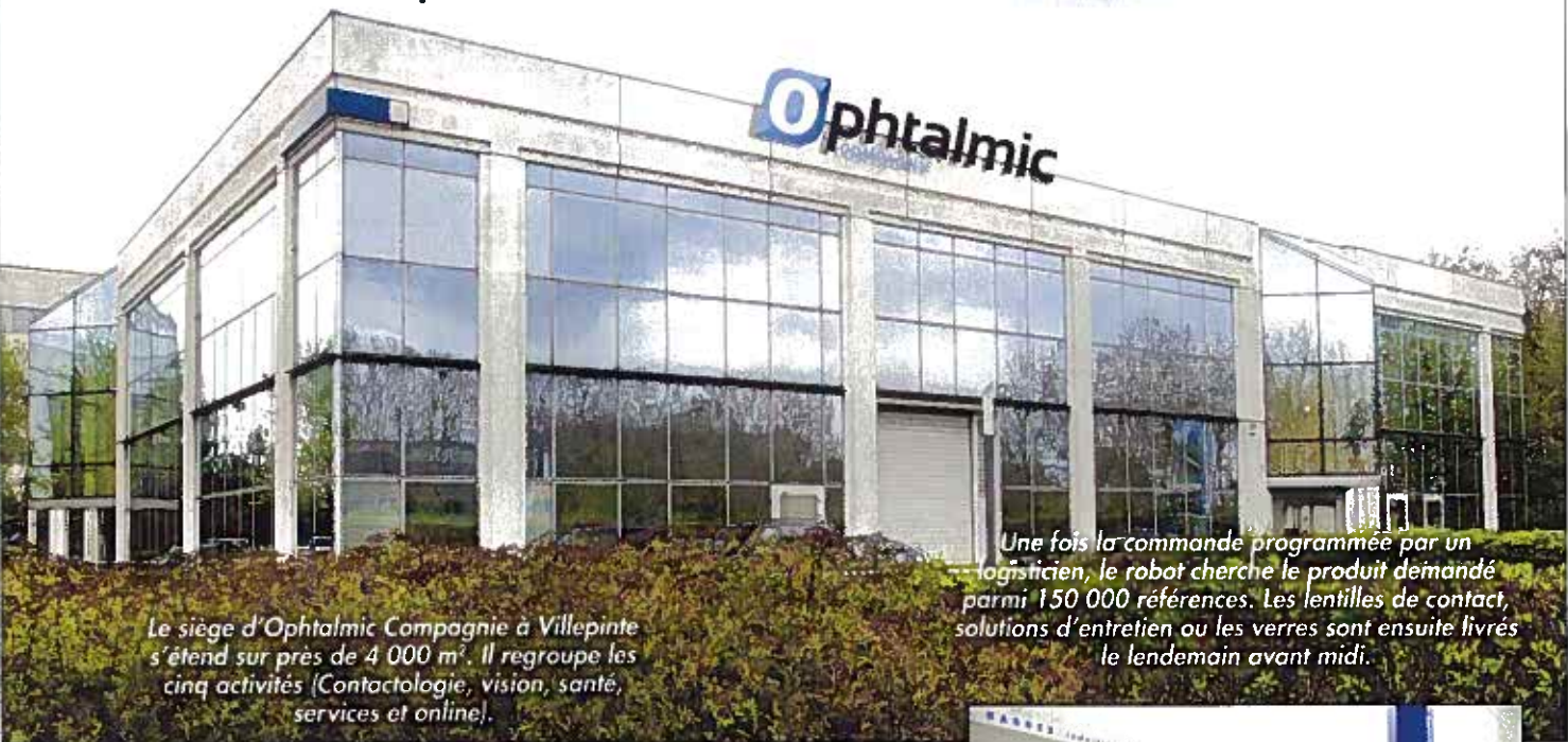
Le siège d'Ophthalmic Compagnie à Villepinte s'étend sur près de 4 000 m 2 . Il regroupe les cinq activités (Contactologie, vision, santé, services et online).