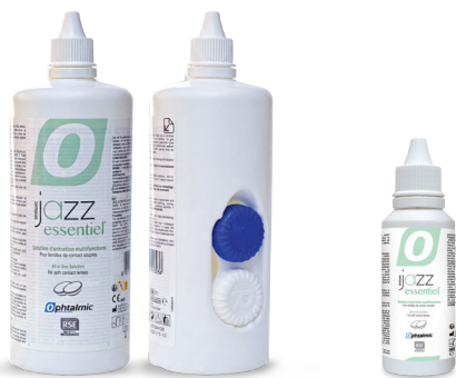
Flacon 400ml Étui intégré